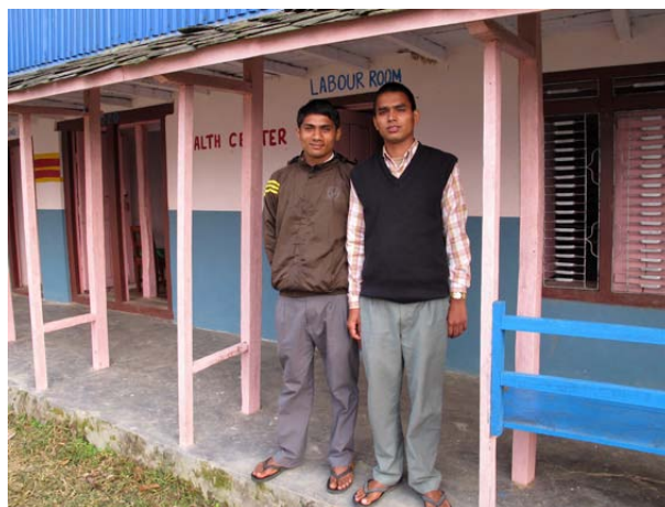
Två av de totalt fyra personer som arbetar på sjukstugan i Jyamrung och som vi kommer att samarbeta nära med.

Syftet är förstås att undersöka och behandla bybor i byn Jyamrung med omnejd men kanske ännu mer att ge personalen vid vår sjukstuga vidareutbildning, och handledning. De personer som arbetar i Jyamrungs sjukstuga och som Tuki Nepal finansierar, har utbildning. Men de är mycket unga och har inte så lång erfarenhet och deras utbildning är ganska kort och motsvarar inte den utbildning vi har i Sverige.