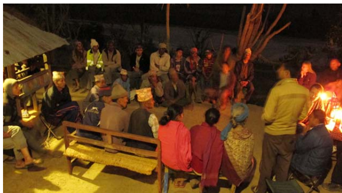
Bymöte om elen en sen kväll i mars