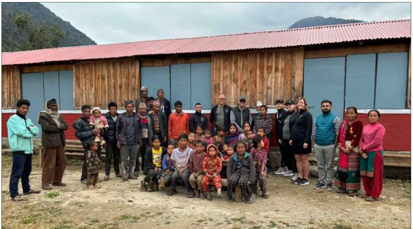
Holtab/ ABB-teamet tillsammans med bybor utanför den skola de sponsrat i Jajarkot